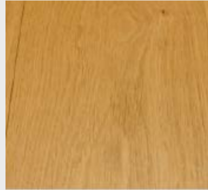
nach der Behandlung